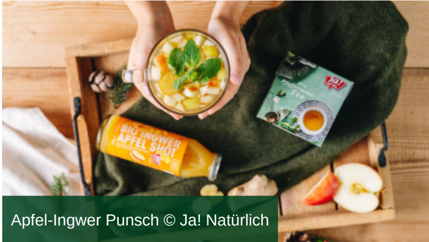
Apfel-Ingwer Punsch